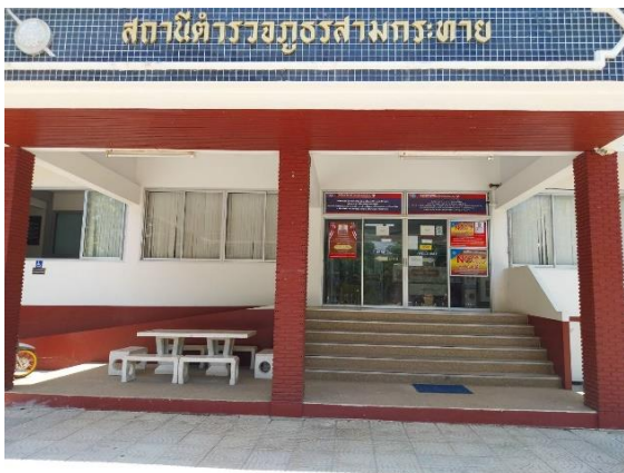
รูปถ่ายผลการดำเนินงานจริง ณ จุดบริการ ของสถานีตำรวจภูธรสามกระชาย