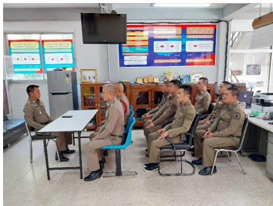
รูปถ่ายผลการดำเนินงานจริง ของสถานีตำรวจภูธรสามกระท่าย