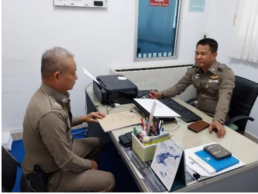
รูปถ่ายผลการดำเนินงานจริง ของสถานีตำรวจภูธรสามกระชาย